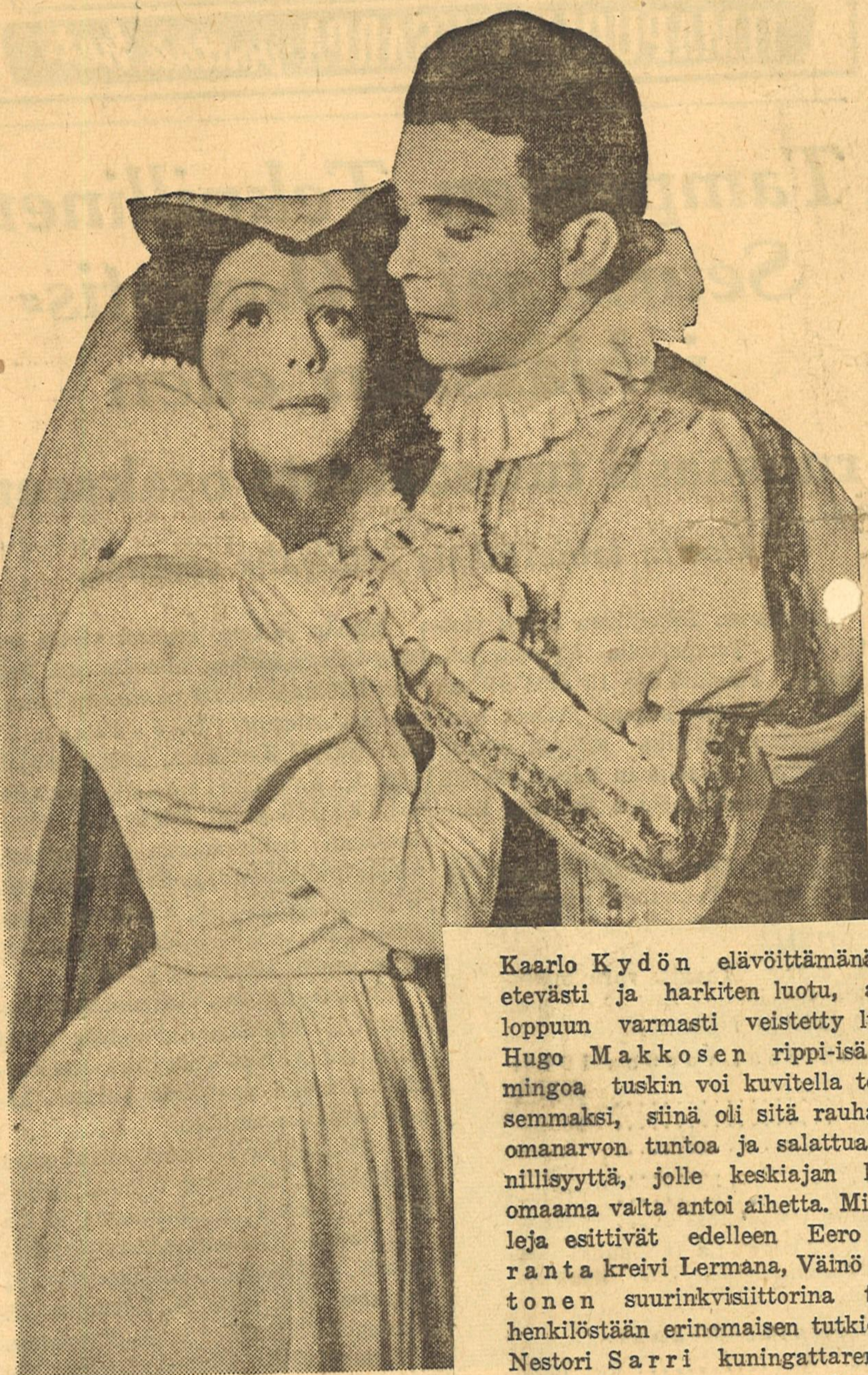
Don Carlos (Ossi Kostia)

oli Espanjan kuningas (historiassa tunnettu „verinen”) ensimmäisen