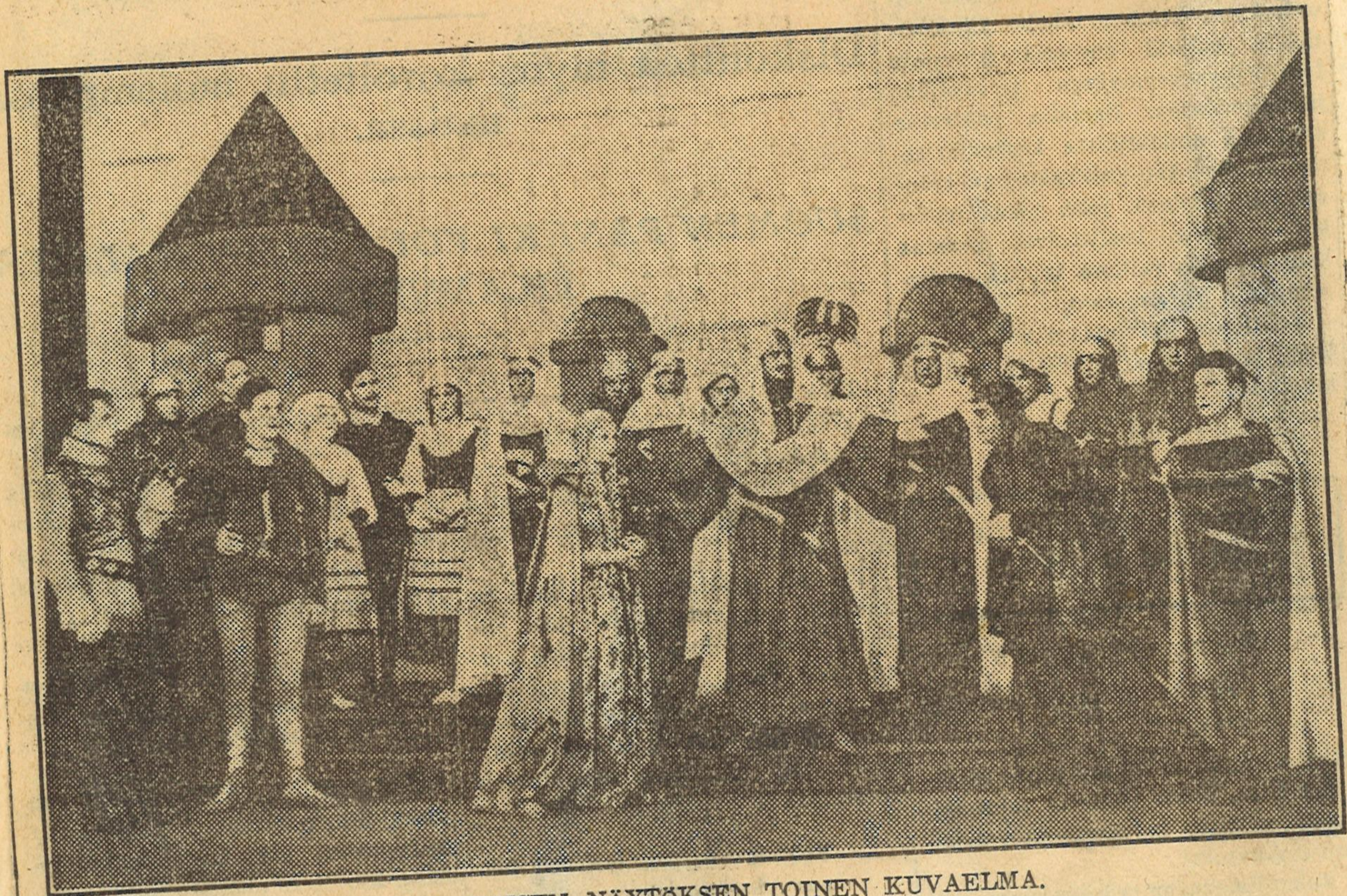
OTHELLO: TOISEN NÄYTÖKSEN TOINEN KUVAVELMA.

Tampereen Työväen Teatterin 30-vuotisjuhlasta muodostui harrastusnelmainen, arvokas juhlatilaisuus vaikka ankean ajan vuoksi juhla vietettiin vain suhteellisen vaatimattomissa puitteissa. Teatterin ystävät olivat juhlaan valmistuneet hartain mielin ja niin ajoissa, että jo perjantain aamuun mennessä olivat ensi-illan liput lisäpaikkoja myöten loppuunmyytyt ja sunnuntain illaksi oli sen johdosta järjestettävä juhla-ohjelman suoritus toinen kerta. Jo hyvissä ajoin ennen määräaikaan täyttyi teatterin katsomo ääriään myöten yleisöä, joka juhlimielin odotti ohjelman alkamista.